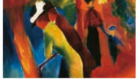
Raum 1.31, August Macke, Sonniger Weg , 1913