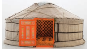
Raum 2.14, Nam June Paik, The Mongolian Tent , 1993