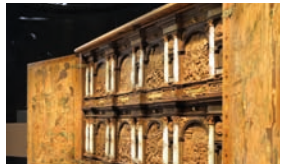
Raum 1.17, Meister mit der Hausmarke, Kabinettschrank, sogenannter Wrangelschrank , 1566