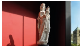
Raum 1.05, Maria und zehn Apostel vom Westportal der Überwasser-Kirche in Münster , um 1370/74