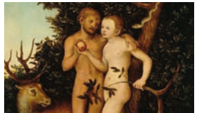
Raum 1.12, Lucas Cranach d. Ä., Adam und Eva , um 1525